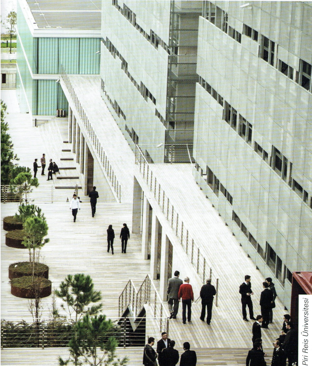
Piri Reis Üniversitesi

Bence mimarinin rolü çok önemli. Geçenlerde Yapı Endüstri Merkezi'n-