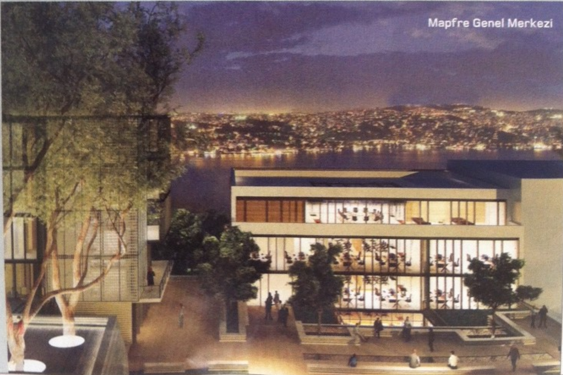
Mapfre Genel Merkezi