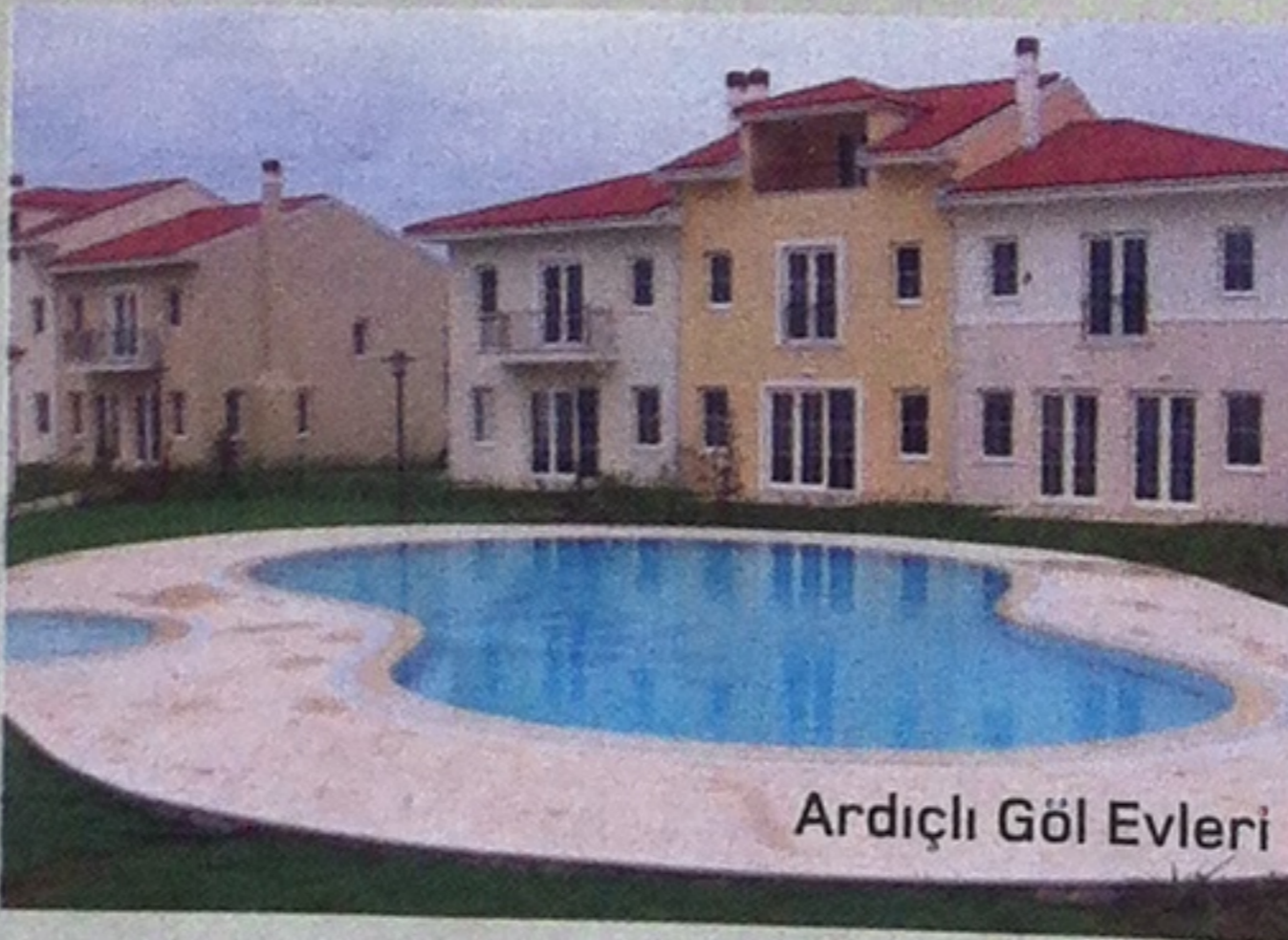
Ardıçlı Göl Evleri