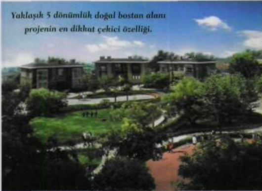
Yaklaşık 5 dönümlük doğal bostan alanı projenin en dikkat çekici özelliği.

hatları arasında benzersiz bir bağlantı kurmaya çalıştık" diyor. Aynı zamanda ailelerin arkadaşları ve komşularıyla hem özel hem de aktif sosyal yaşamın tadını çıkaracağı bir proje yaratmak istemiş. "Evler sokağı görece şekilde tasarlandı. Arazinin bir parçasıymış gibi yerleştirildiler."