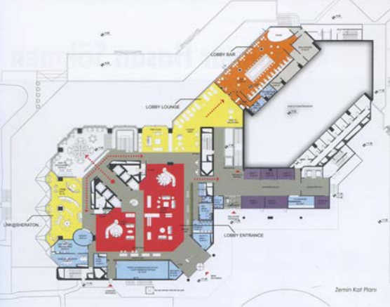
Zemin Kat Plansı