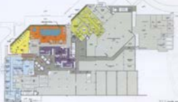
-2. Kat Plansı