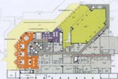
-1. Kat Plansı