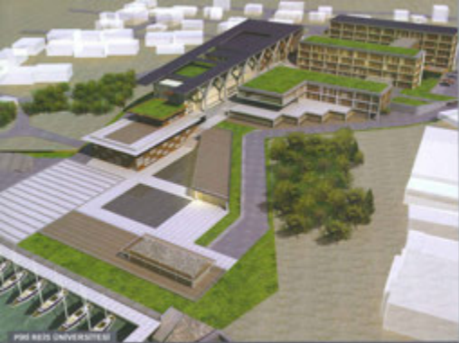
PIRI REİS ÜNİVERSİTESİ